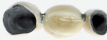
Widok od środka na 3 punktowy most

Podbudowa metalowa zawierająca ciemne krawędzie.